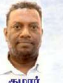
குமார் மாவுடத் தலைவர்