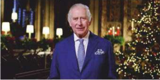
இங்கிலாந்து மன்னர் மூன்றாம் சார்லஸ், புற்றுநோய் பாதிப்பு கண்டறியப்பட்டுள்ளதாக